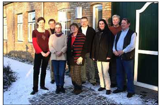
Einige Regionsgästeführer beim Besuch der Eider-Treene-Sorge GmbH

Drei Semester lang haben sich 12 Bürger aus der Region an der Volkshochschule Heide zu Regionsgästeführern ausbilden lassen. Landesgeschichte, Historie und Kultur der Eider-Treene-Sorge Region standen dabei ebenso auf dem Lehrplan wie Recht oder Tourismus in Schleswig-Holstein.