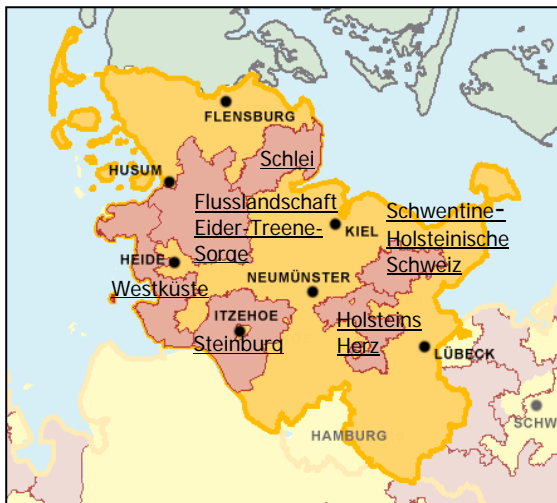
Lage der 6 LEADER+ Regionen in Schleswig-Holstein.

Hierbei ist es besonders erfreulich, dass unter großem Engagement der sechs schleswig-holsteinischen LEADER+ Geschäftsstellen auch eine Vielzahl an überregionalen Kooperationsprojekten entwickelt werden konnte. Denn regionsübergreifende Zusammenarbeit und Erfahrungsaustausch werden in Zeiten voranschreitender Globalisierung zunehmend wichtiger.