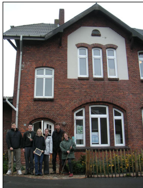
Das NUZ Team vor dem ehemaligen Hohner Bahnhof.

Moore, Seen und Fischotter – das sind die Themen, die sich das Natur- und Umweltzentrum in Hohn auf die Fahnen geschrieben hat. Mit dem Ziel, diese für die Eider-Treene-Sorge Region typischen Arten und Lebensgemeinschaften für Gäste und Einheimische erlebbar zu machen, wird derzeit in Zusammenarbeit mit anderen Bildungseinrichtungen und Akteuren vor Ort, ein ganzheitliches Konzept umgesetzt, welches die Bausteine Umweltbildung, Fischotterfreigehege und Gestaltung der Außenbereiche umfasst.